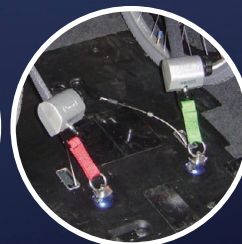
車いす後側の固定状態