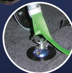
アンカープレートに簡単固定